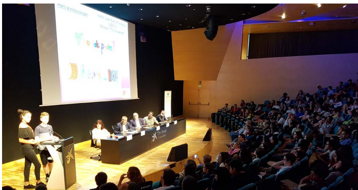
Cosmocaixa, 5 juny 2018

L'acte de lliurament de premis a les escoles guanyadores es va realitzar el dimarts 5 de Juny de 2018 a la Sala d'Actes de Cosmocaixa.