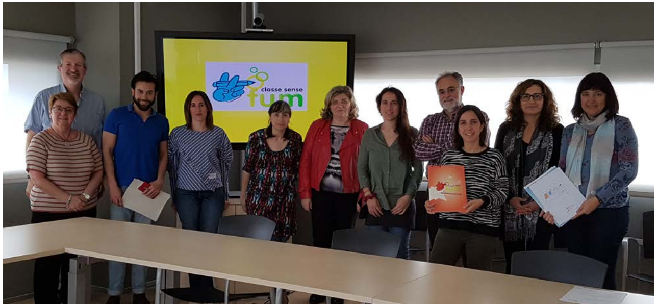
Jurat CsF 2017-18 (15 maig 2018) ASPCAT