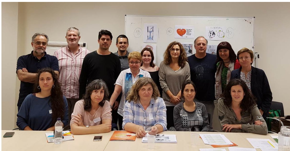
Jurat CsF 2016-17 (11 maig 2017) ASPC

El sorteig de premis es va realitzar segons les bases del concurs. A cada aula que havia arribat al final del programa li corresponia un número. Tots els números es van introduir en una urna, a l'atzar, es van extreure els quatre números que correspondrien als 4 Premis d'Activitats d'Esport i Salut. Es van extreure, també per ordre, 4 números de reserva.