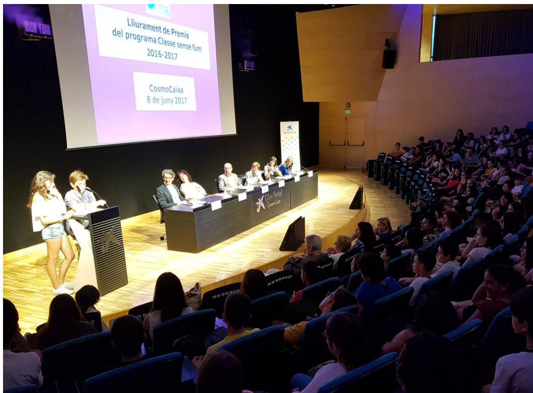
Cosmocaixa, 7 juny 2016

L'acte de lliurament de premis a les escoles guanyadores es va realitzar el dijous 8 de Juny de 2017 a la Sala d'Actes de Cosmocaixa.