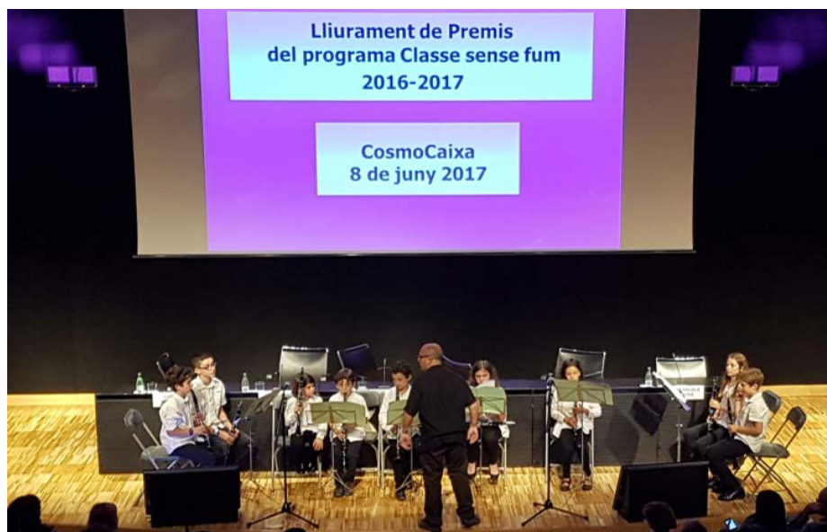
Cosmocaixa, 8 juny 2017