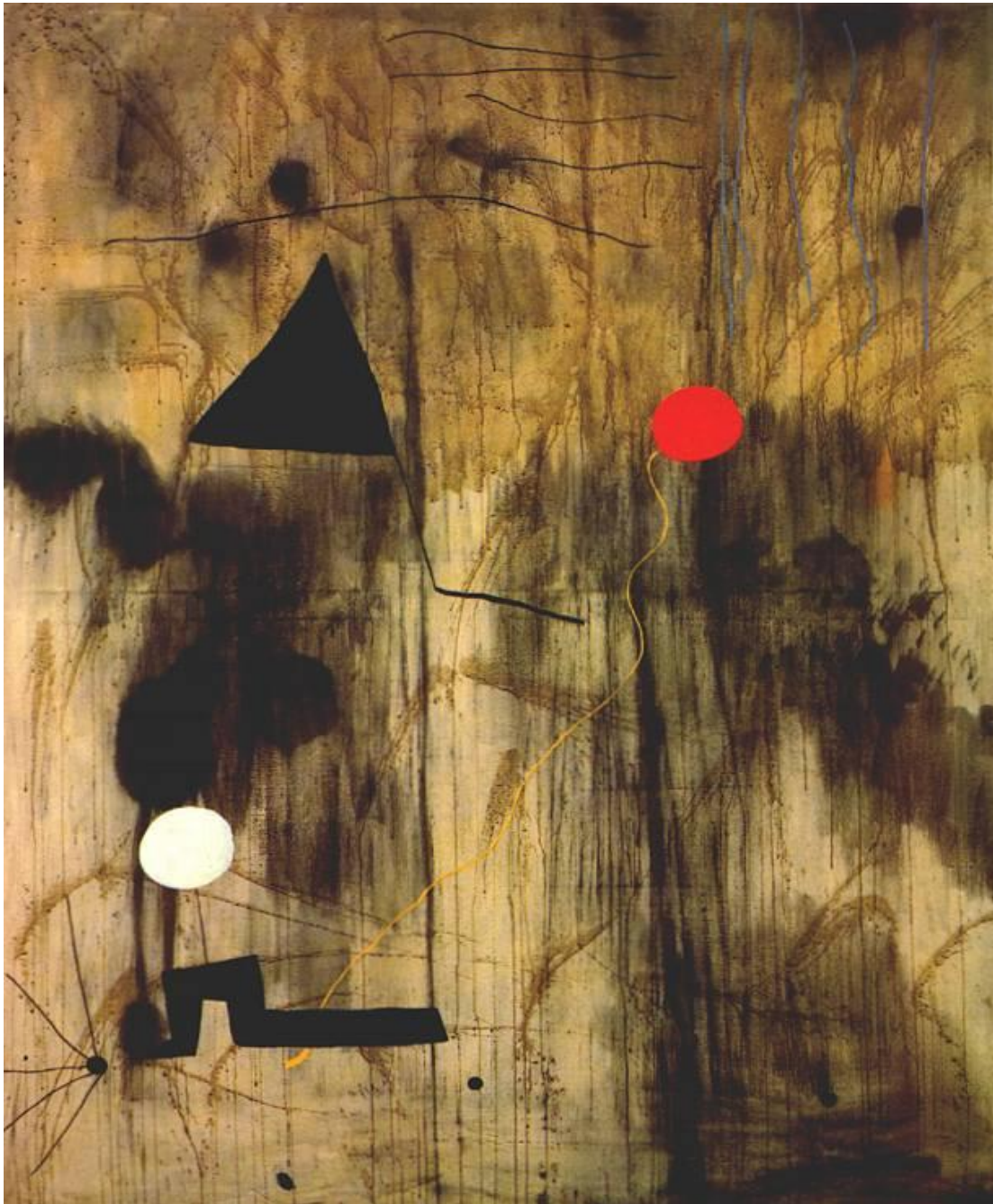
Naixement del món, Joan Miró (MoMA)