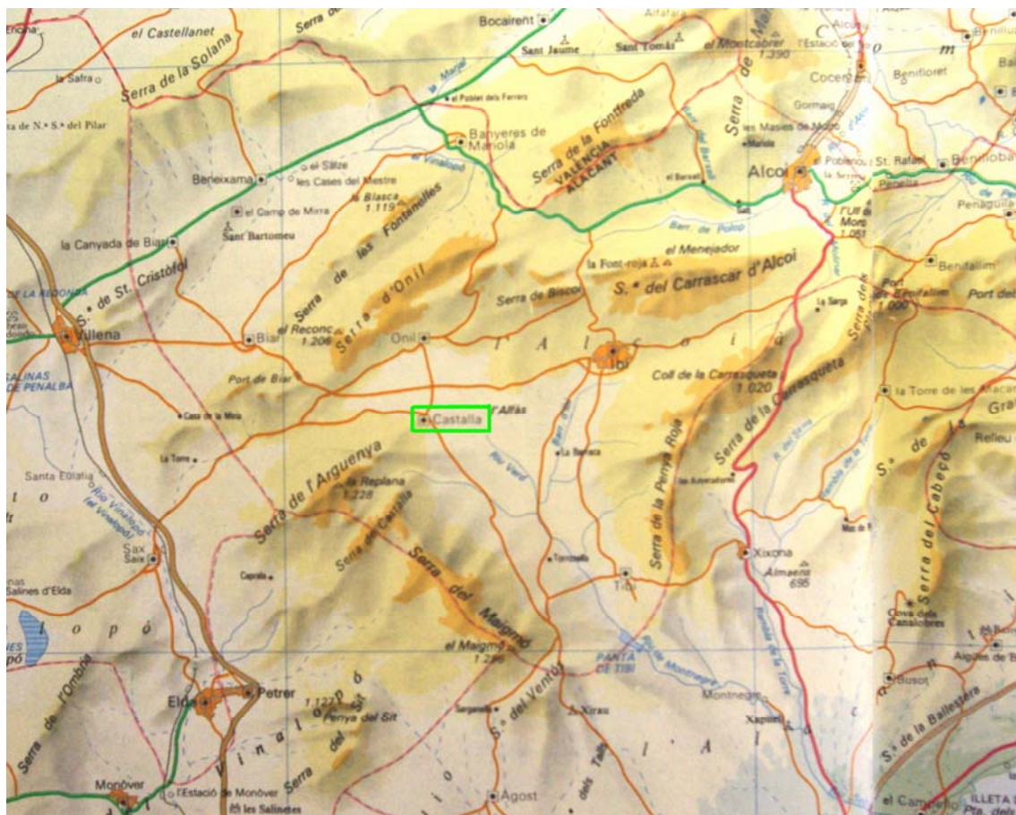
Atles Universal Català. GEC