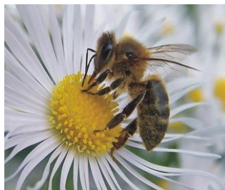
Una abella es posa a una flor

Els tècnics responsables de l'elaboració de l'informe asseguren que les causes d'aquest fenomen són la utilització d'insecticides i altres productes fitosanitaris, i la contaminació ambiental.